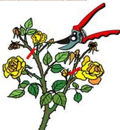
OREZIVANJE PRECVETALIH CVETOVA